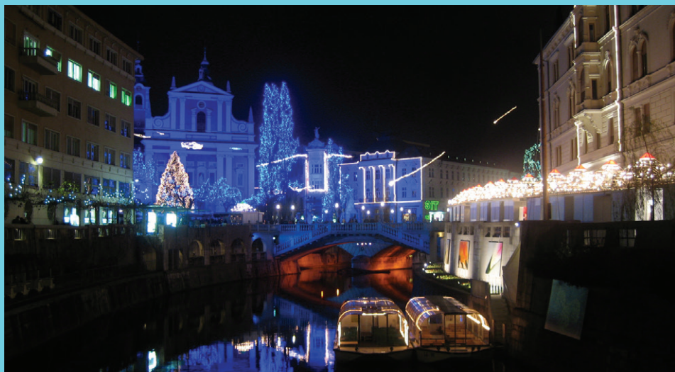
Utrinek veselega decembra v Ljubljani