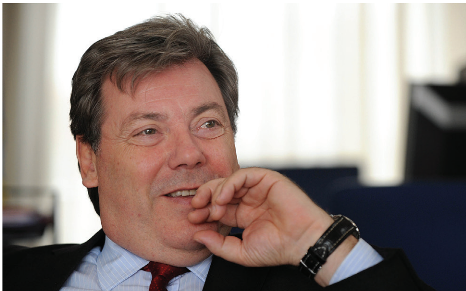
Veleposlanik Republike Slovenije na Hrvaškem Vojko Volk