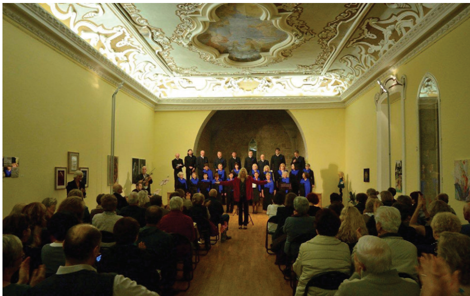
Nastop zbora Encijan v poreški Sabornici

Po otvoritvi smo nadaljevali z druženjem v galeriji in Slovenskem domu.