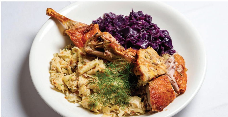
Pečena raca, rdeče zelje in mlinci – tradicionalna jed za martinovanje

mladimi, seveda v slovenskih društvih. Morda so prav slovenska društva okolje, v katerem bi lahko mlade spodbujali k temu, da bi raziskovali slovenske tradicionalne jedi in se jih učili pripravljati, postreči in razširjati. Morda so slovenska društva tudi prostor za oblikovanje, krojenje in šivanje slovenskih noš in podobno.